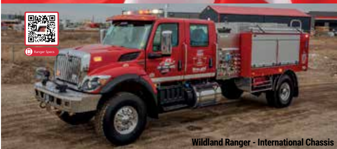
Wildland Ranger - International Chassis