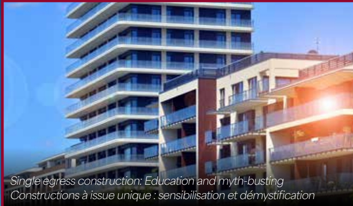
Single egress construction: Education and myth-busting Constructions à issue unique : sensibilisation et démystification

The official publication of the Canadian Association of Fire Chiefs