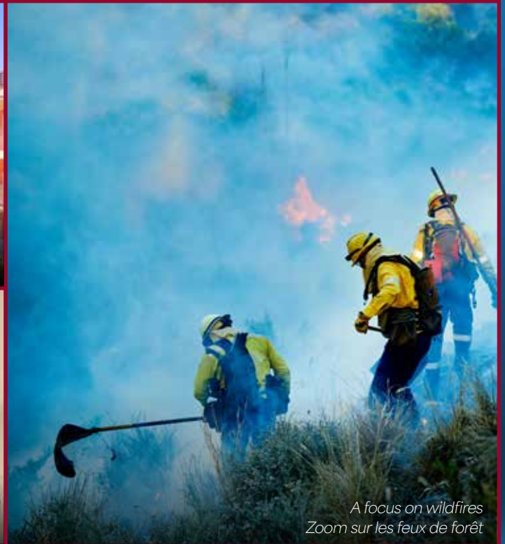
A focus on wildfires Zoom sur les feux de forêt