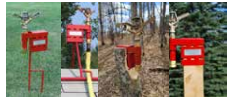
Elevated Sprinkler Mount