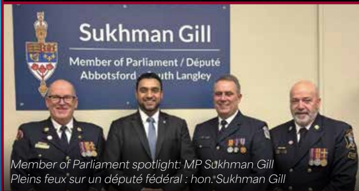
Member of Parliament spotlight: MP Sukhman Gill Pleins feux sur un député fédéral : hon. Sukhman Gill