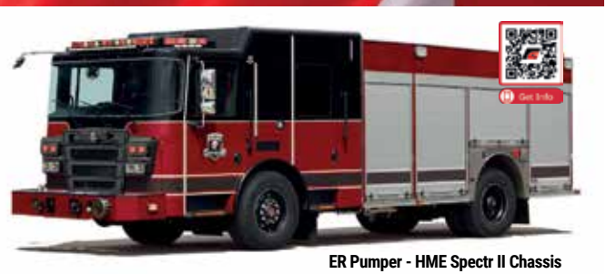
ER Pumper - HME Spectr II Chassis

Fort Garry Fire Trucks is the largest fire apparatus manufacturer in Canada and a proud builder of fire trucks, custom pumpers, aerial ladders, and related firefighting equipment. Headquartered in Winnipeg, Manitoba, we serve cities, towns, and municipalities across Canada, the U.S., and abroad—delivering equipment proven to perform in the harshest weather, climates, and terrain. With one of the largest engineering departments in the industry, we