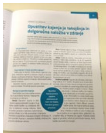
Fotografia 9: Articolul publicat (partea a 2-a)