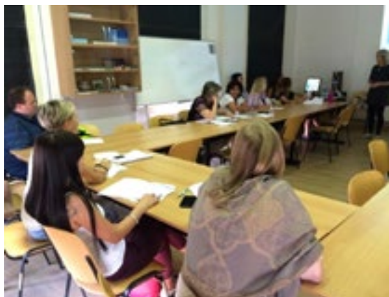
Fotografia 3: Fotografie workshop

Pentru partea orală a conferinței poster SRNT-Europe, a fost adoptat posterul pe tema “Instrucțiunile instructorilor în cadrul workshop-urilor ca și model pentru creșterea capacității nursingelor de a interveni în procesul de dependență de tutun – un model pentru Europa de Est”.