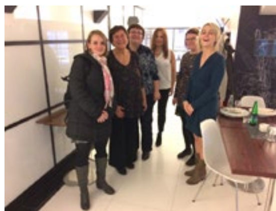
Fotografia 6: O parte din personalul și colaboratorii STTD (unii, de asemenea, au ținut prezentări la conferință).

Conferința “Tutunul & Sănătatea” organizată de către Societatea pentru Tratamentul Dependenței de Tutun (STTD) a avut loc în data de 9 noiembrie 2016.