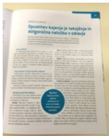
Fotografia č. 9: Zverejnený článok (2. časť)