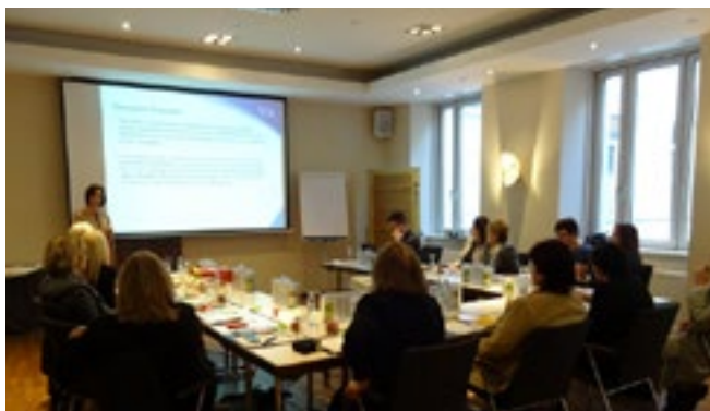
Fotografia č. 14: Stella pri hodnotení analýzy dát vyplývajúcich z focus groups

Popoludňajšie rokovanie bolo venované vyhodnoteniu výsledkov jednotlivých krajín (konkrétne e-learningovej aktivity a údajov vyplývajúcich z focus groups) a interpretácii dát a zameralo sa takisto na postup pri popularizácii projektu.