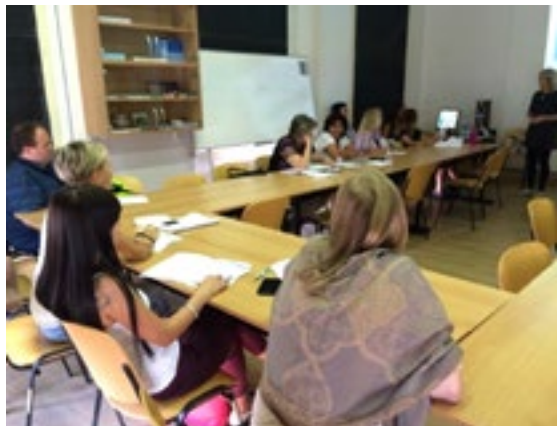
Fotografia č. 3: Fotografia z workshopu

Pre ústnu posterovú prezentáciu bol na konferencii SRNT Europe prijatý poster s titulkom „Školenie školiteľov na workshopoch ako model pre zlepšenie schopnosti sestier intervenovať v prípade závislosti od tabaku – model určený pre východnú Európu“.