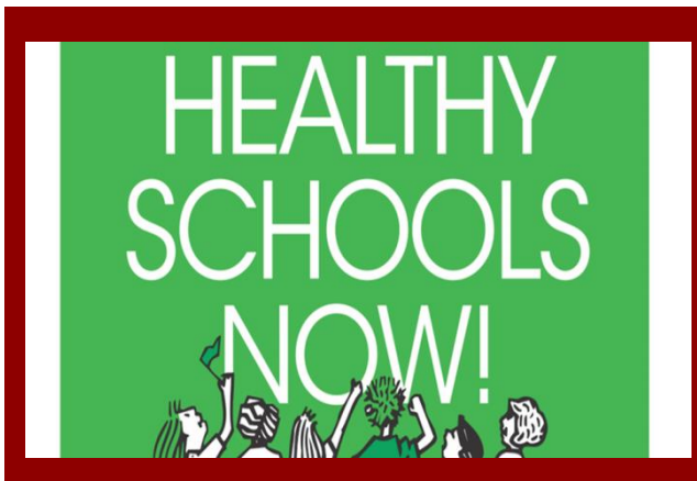
Healthy Schools Now Second Quarterly Coalition Meeting

https://www.eventbrite.com/e/creating-emotionally-intelligent-classrooms-strategies-for-educators-tickets