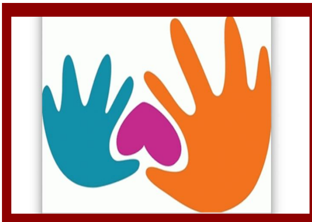
Creating Emotionally Intelligent Classrooms: Strategies for Educators